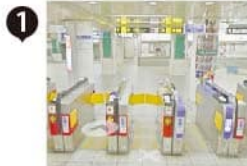
南改札から地下街をまっすぐ