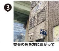
交差の角を左に曲がって