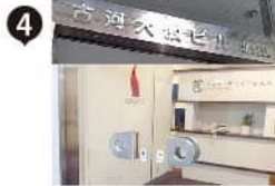
左手に見える古河大阪ビル内 1Fです。