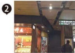
突き当たり軒屋の右横通路へ