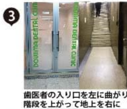
歯医者さんの入り口を左に曲がり 階段を上って地上を右に