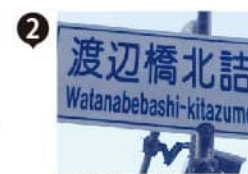
河を渡って交差点を過ぎ