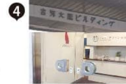
右手に見える古河大阪ビル内 1Fです。